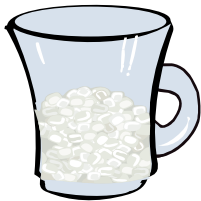
μισή κούπα αλάτι