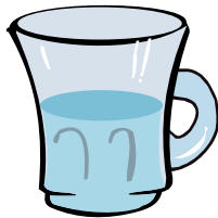
μισή κούπα νερό